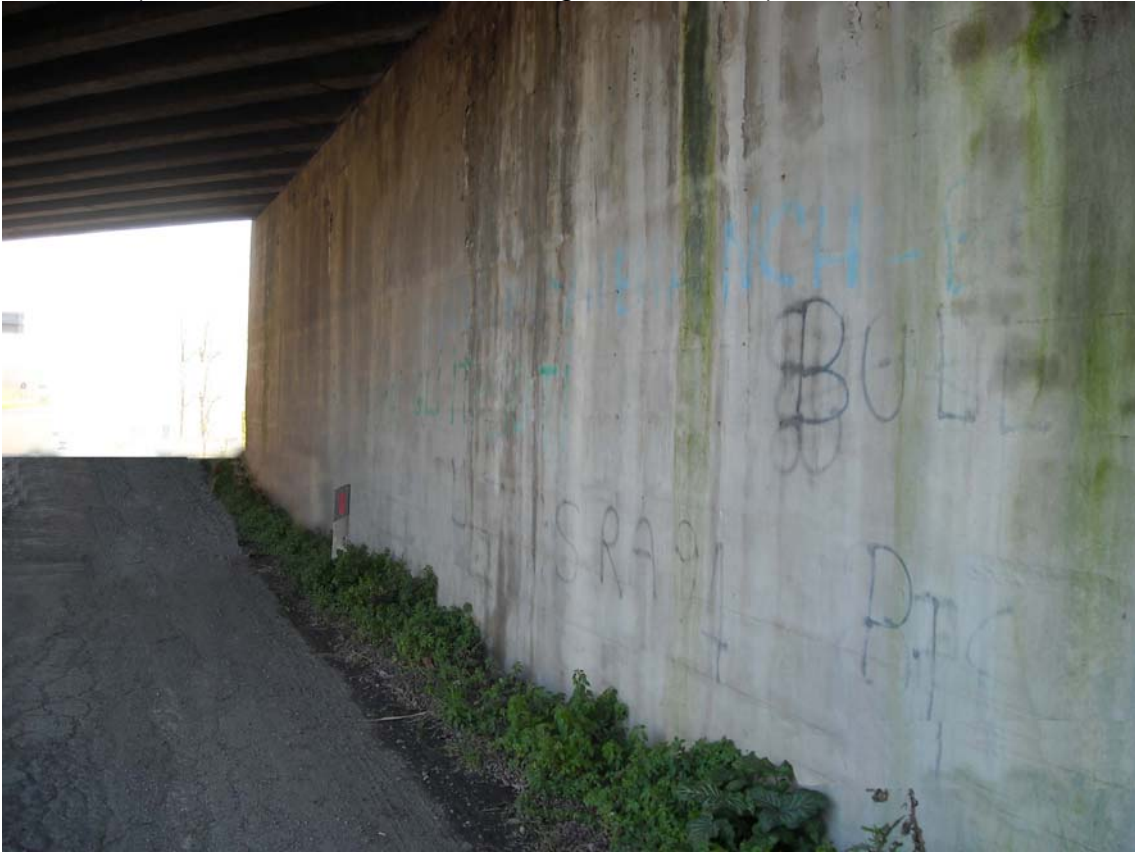
VIA TRIESTE (sottopasso "Parcheggio Scambiatore") CICLO - PEDONALE – Lunghezza circa 13 m – Altezza 2,40