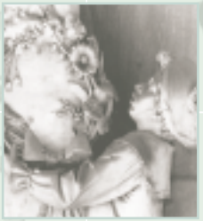
Scultura di Alessandro Massarenti sul sepolcro di Domenico Rivalta.

Sol chi non lascia eredità d'affetti poca gioia ha dell'urna... Ugo Foscolo (Dei Sepolcri)