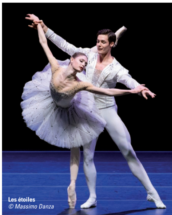
Les étoiles © Massimo Danza