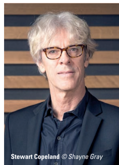
Stewart Copeland

“La musica non è solo un atto estetico, ma anche etico”: Riccardo Muti aveva risposto così a chi chiedeva il perché del concerto nel carcere di Ravenna nel 2018. Una lezione che i giovani della sua Orchestra Giovanile Cherubini, a meno di un anno di distanza, fanno propria con 22 concerti in 13 luoghi in città e provincia, fino al 30 luglio, destinati al volontariato, alla cura e al recupero delle persone. “La musica senza barriere” vede impegnate una varietà di formazioni da camera in programmi che spaziano da Bach e Mozart a Rota e Morricone. A partire dalla Casa Circondariale di Ravenna, i Cherubini saranno anche all’Ospedale S. Maria delle Croci, all’Associazione Alzheimer e all’Opera di Santa Teresa - Caritas, presso centri sociali, comitati, coordinamenti del volontariato tra Ravenna, Bagnacavallo, Russi, Alfonsine, Cervia. Con il sostegno della Fondazione Cassa di Risparmio di Ravenna e della Fondazione del Monte di Bologna e Ravenna, accanto al Lions Club Host, e la collaborazione di Consulta delle Associazioni di Volontariato Comune di Ravenna, Associazione Il Paese, Associazione “Per gli altri”.