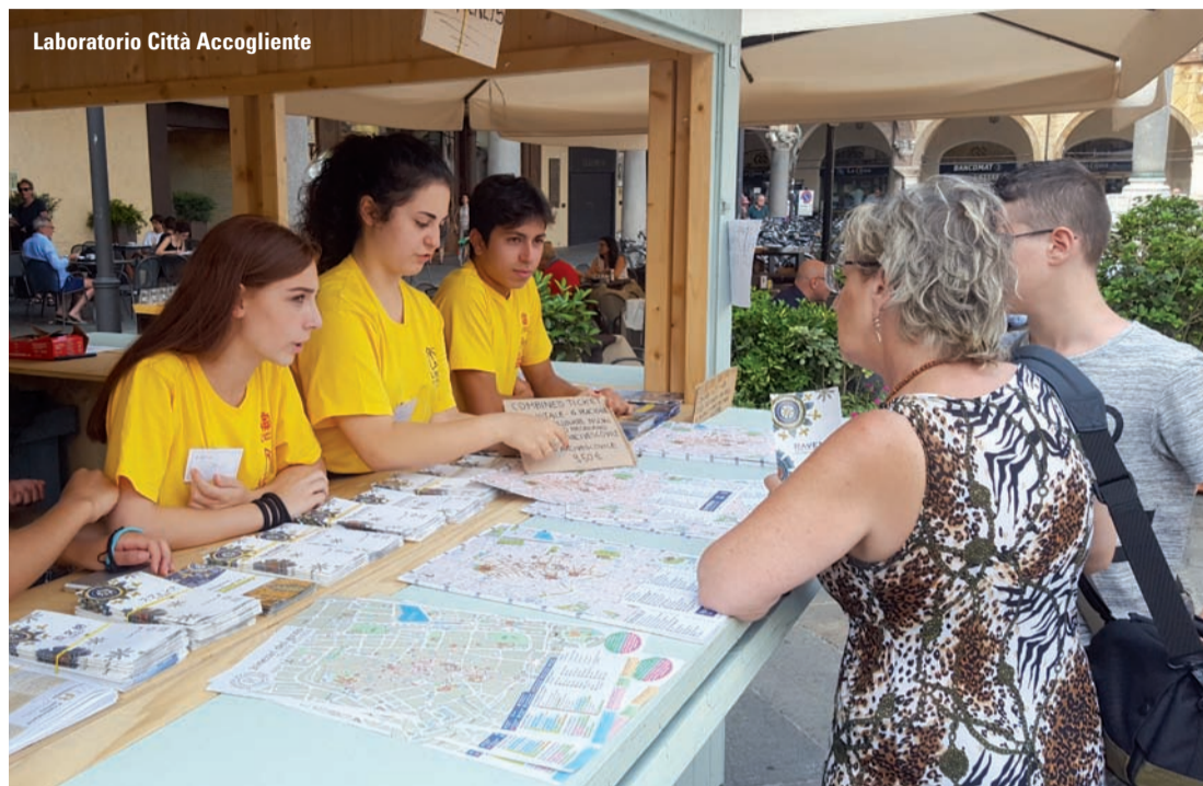
Laboratorio Città Accogliente

grande festa di chiusura in programma all'Almagià, durante la quale ci saranno la consegna degli attestati e una serie di esibizioni artistiche preparate ad hoc, unitamente a percorsi espositivi e fotografici, per una serata pubblica di restituzione alla cittadinanza di quanto realizzato dai ragazzi e dalle ragazze protagonisti del progetto. Nel corso degli anni i ravennati hanno imparato a riconoscere ed apprezzare le Magliette Gialle e sempre più frequentemente si fermano per complimentarsi con loro e chiedere notizie circa le attività che svolgono. L'interesse e la curiosità per il progetto non si limitano però solo ai ravennati; diverse amministrazioni di altre province e regioni hanno infatti chiesto incontri di approfondimento con l'obiettivo di attivare iniziative analoghe.