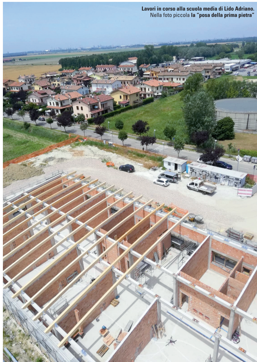
Lavori in corso alla scuola media di Lido Adriano. Nella foto piccola la "posa della prima pietra"