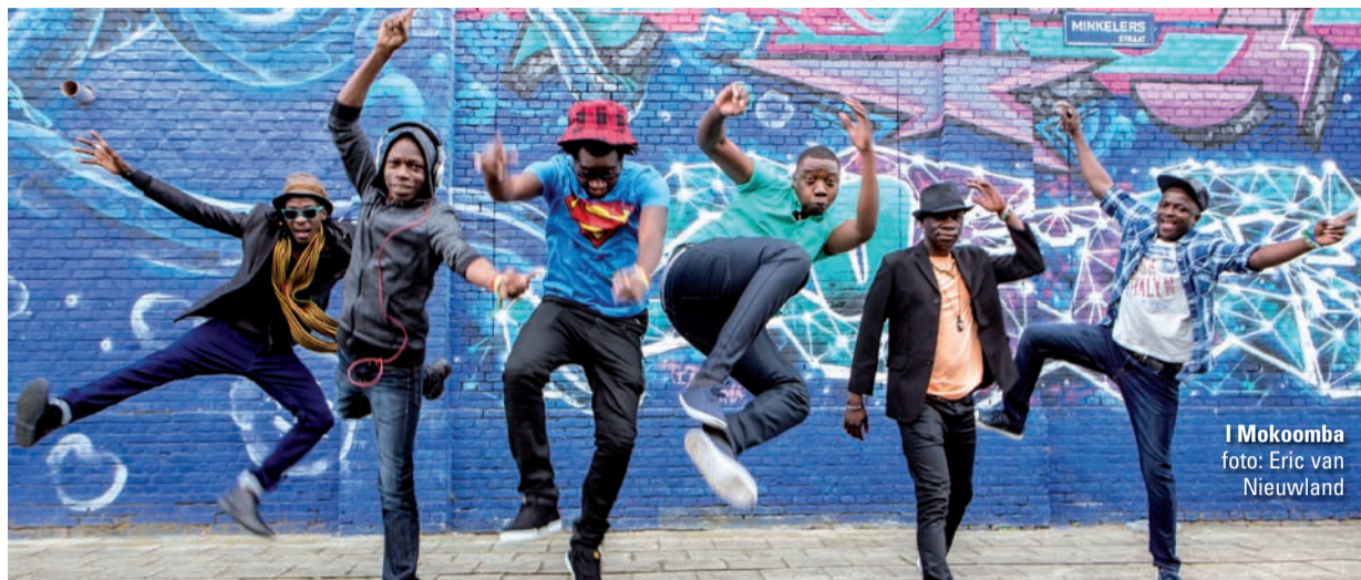
I Mokoomba