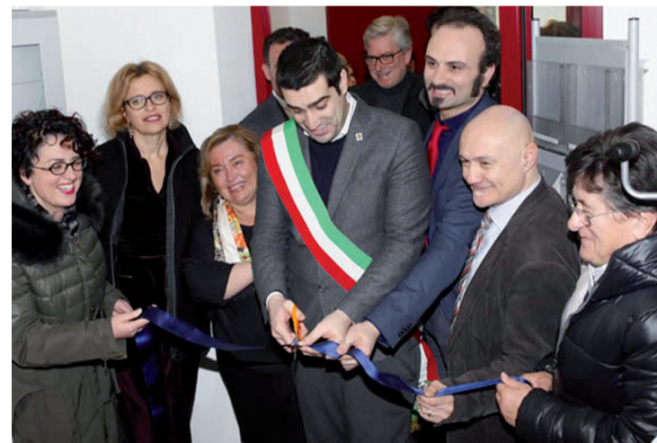
L'inaugurazione della Casa della salute di Sant'Alberto

Nel resto della provincia al momento vi sono un'altra Casa della Salute a Cervia, poi a Russi, Bagnacavallo, Villanova di Bagnacavallo, Alfonsine, Fusignano, Conselice, Cotignola, Bagnara, Massa Lombarda, Brisighella, Castel Bolognese, Cotignola, Faenza, Lugo-Voltana, Casola Valsenio, Riolo Terme e Solarolo.