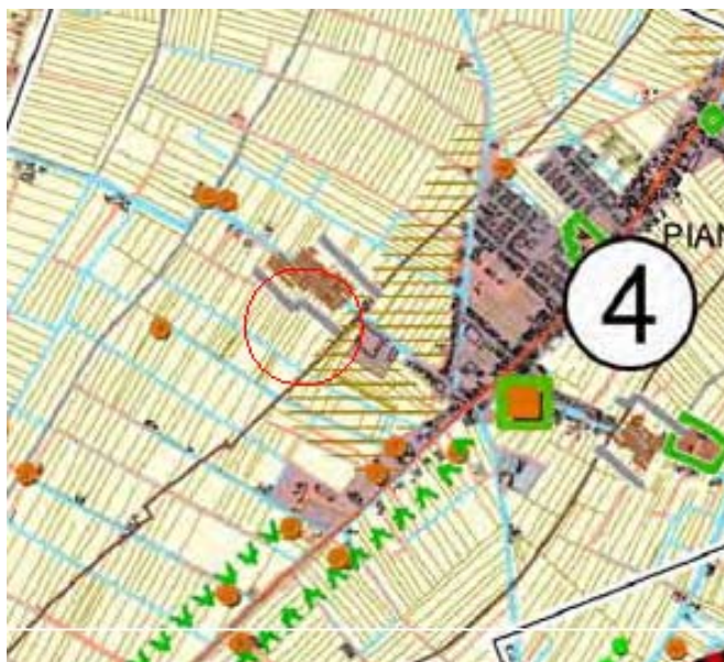
Esempio: Stralcio Elaborato RUE7.3 contesto 4.2

o altra scala rapportata alla dimensione dell’intervento e all’intorno paesaggistico dello stesso, in cui siano individuati ed evidenziati i “segni” del paesaggio. Nello specifico dovranno essere evidenziati oltre ai segni naturali e antropici significativi (quali: strade; autostrade; ferrovie; corpi idrici; centri, nuclei ed edifici limitrofi; ecc.), anche gli elementi esistenti della stessa tipologia dell’intervento oggetto di istanza (es: se oggetto di istanza è un nuovo edificio agricolo di servizio, vanno evidenziati gli esistenti del contesto limitrofo per capirne localizzazione, orientamento e posizionamento rispetto strade ed edifici del complesso di appartenenza, al fine di verificare se i medesimi criteri sono applicabili anche nell’edificio oggetto di intervento). Vanno inoltre evidenziati i punti significativi alla percezione dell’intervento.