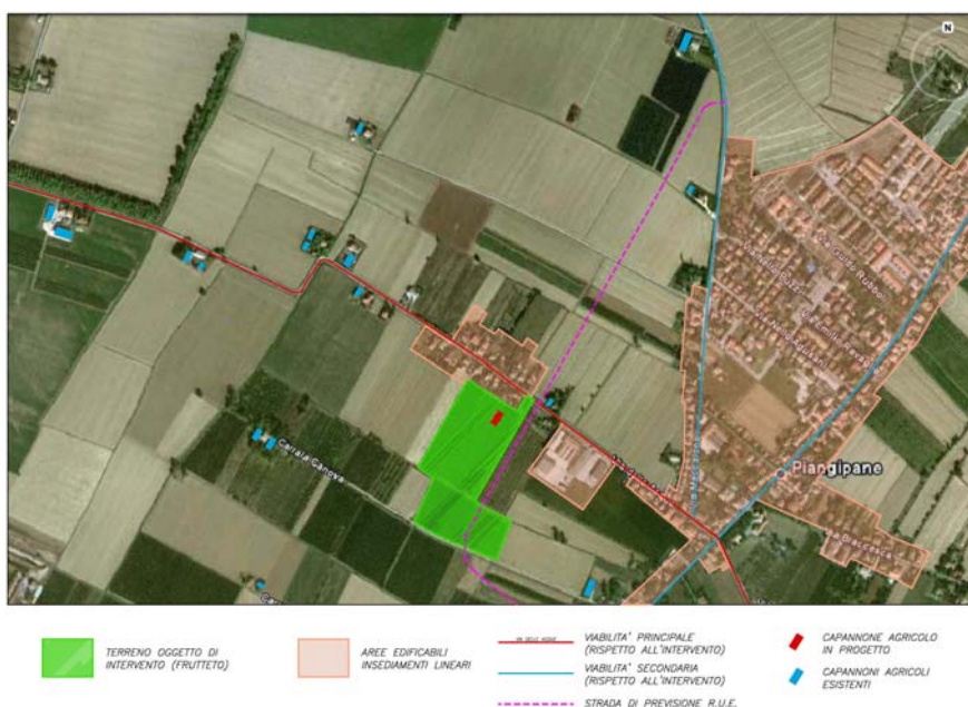
Esempio: Ortofoto con evidenziati segni paesaggio e oggetti esistenti analoghi a quello di progetto

o altra scala rapportata alla dimensione dell’intervento e all’intorno paesaggistico dello stesso, in cui siano individuati ed evidenziati i “segni” del paesaggio. Nello specifico dovranno essere evidenziati oltre ai segni naturali e antropici significativi (quali: strade; autostrade; ferrovie; corpi idrici; centri, nuclei ed edifici limitrofi; ecc.), anche gli elementi esistenti della stessa tipologia dell’intervento oggetto di istanza (es: se oggetto di istanza è un nuovo edificio agricolo di servizio, vanno evidenziati gli esistenti del contesto limitrofo per capirne localizzazione, orientamento e posizionamento rispetto strade ed edifici del complesso di appartenenza, al fine di verificare se i medesimi criteri sono applicabili anche nell’edificio oggetto di intervento). Vanno inoltre evidenziati i punti significativi alla percezione dell’intervento.