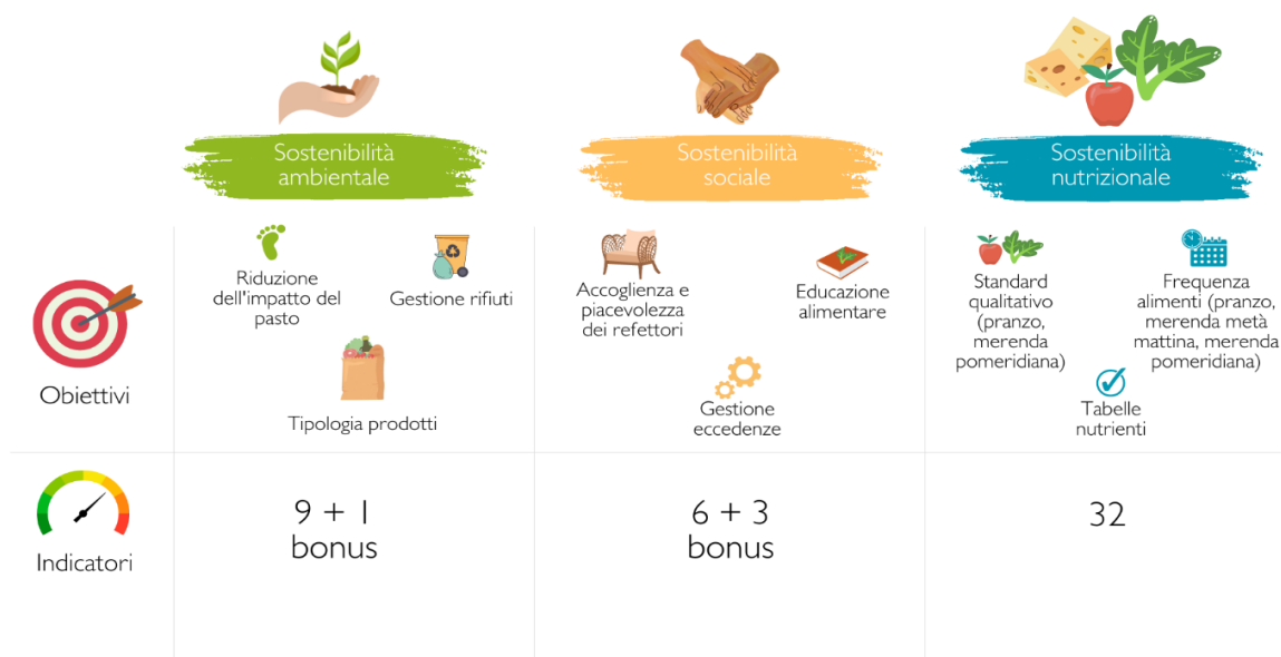
Figura 2. Obiettivi e indicatori del Toolkit di valutazione di sostenibilità integrata.

La Figura 2 presenta invece obiettivi e numero di indicatori per ogni pilastro della sostenibilità.