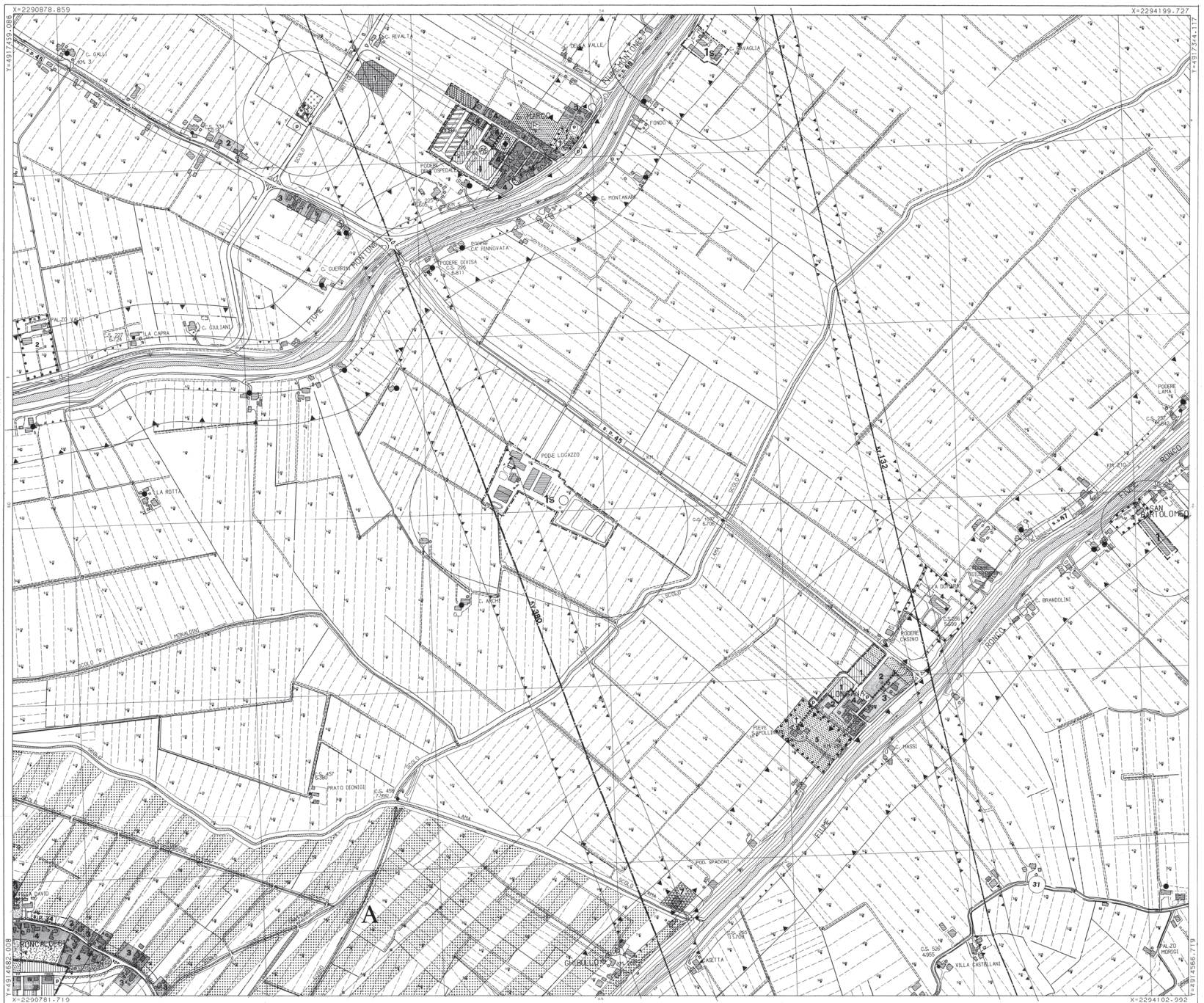
S. Marco - Longana