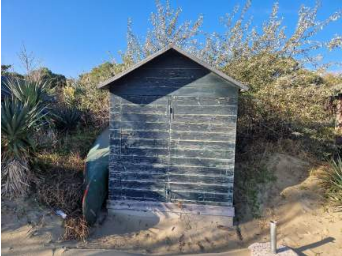
CAPANNO SENZA NUMERO