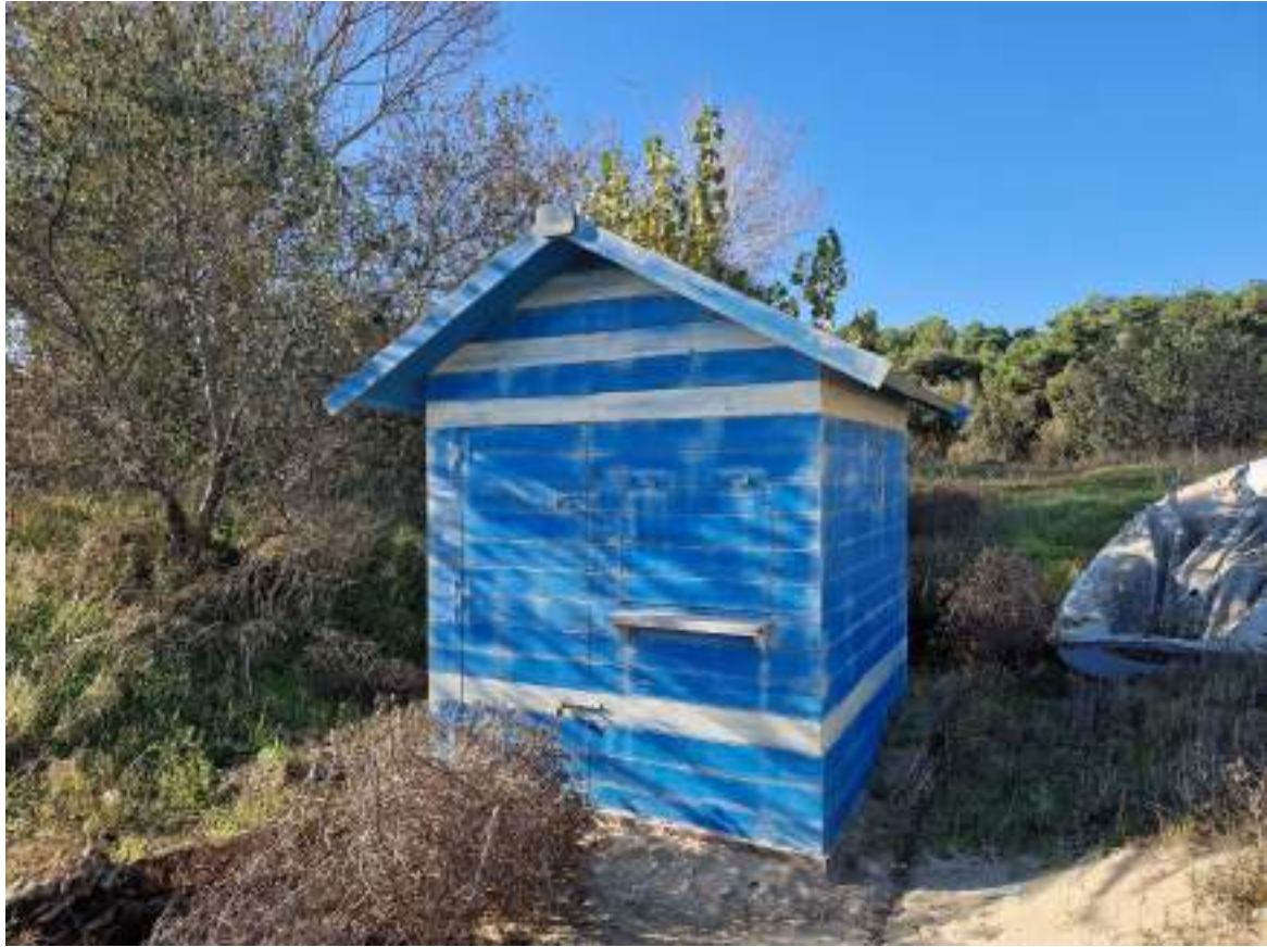
CAPANNO SENZA NUMERO