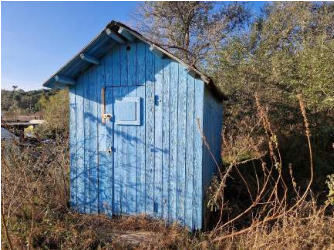
CAPANNO SENZA NUMERO