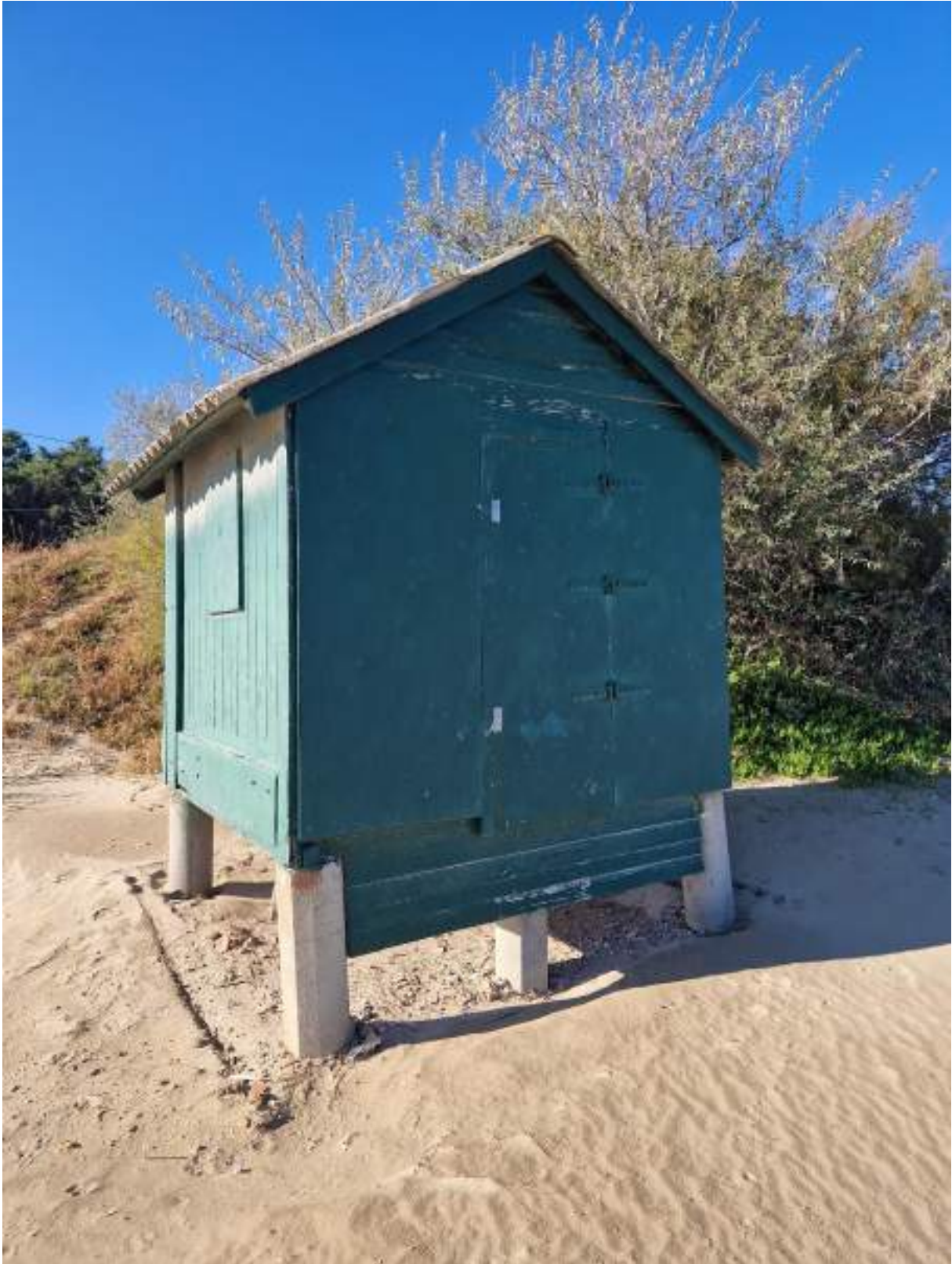
CAPANNO SENZA NUMERO