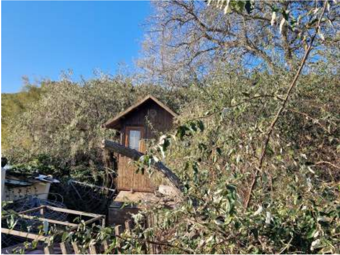
CAPANNO SENZA NUMERO