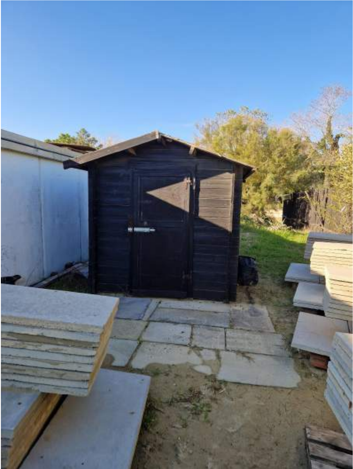
CAPANNO SENZA NUMERO