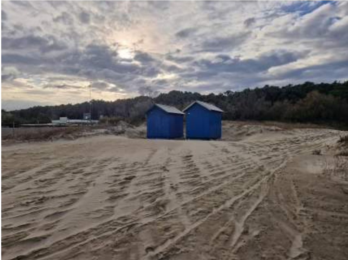
CAPANNI 106 - 99