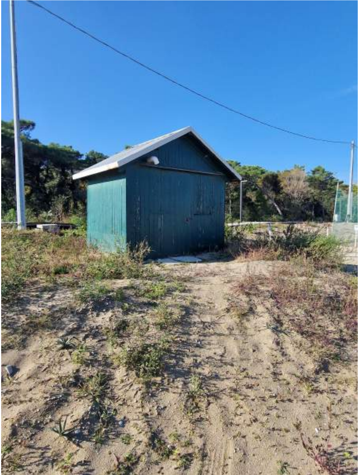
CAPANNO SENZA NUMERO