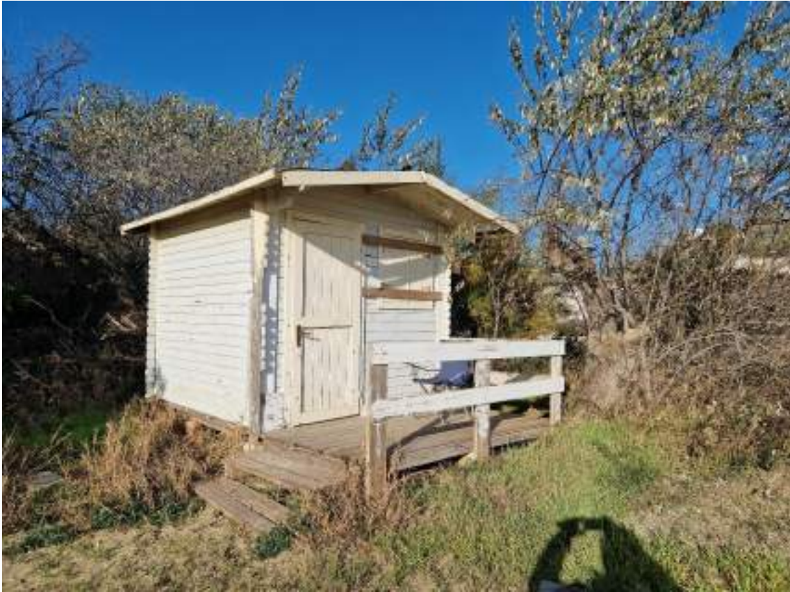
CAPANNO SENZA NUMERO