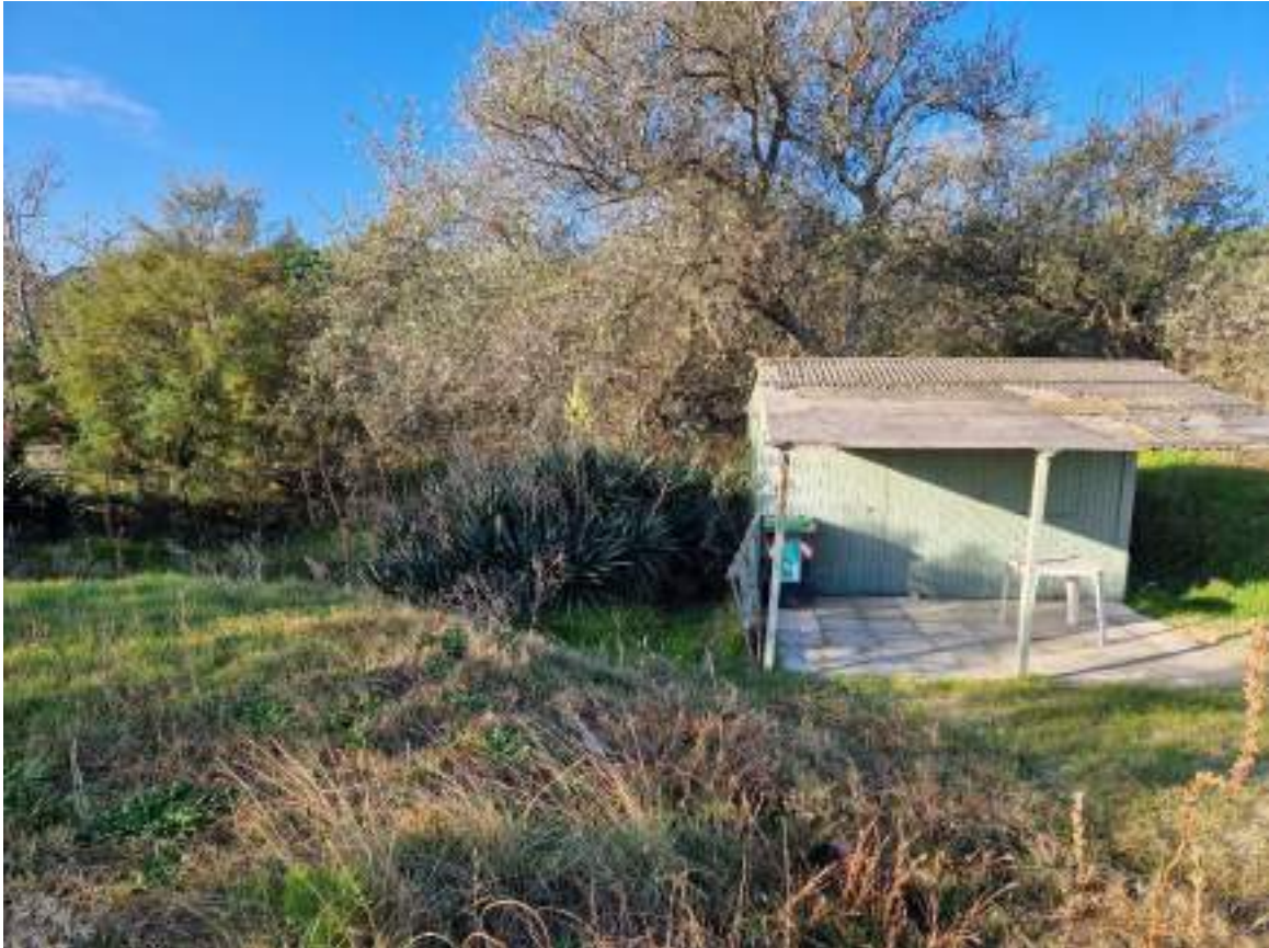
CAPANNO SENZA NUMERO