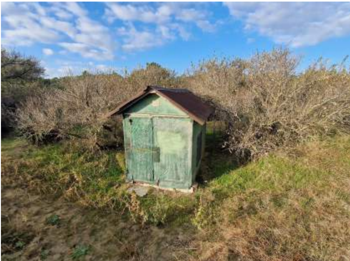
CAPANNO SENZA NUMERO