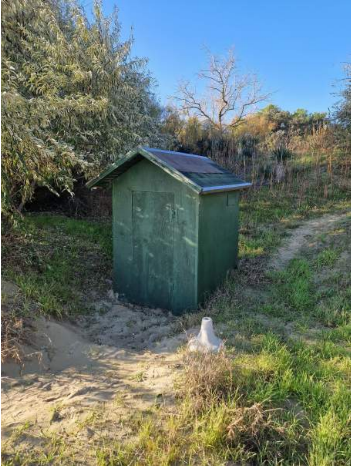
CAPANNO SENZA NUMERO