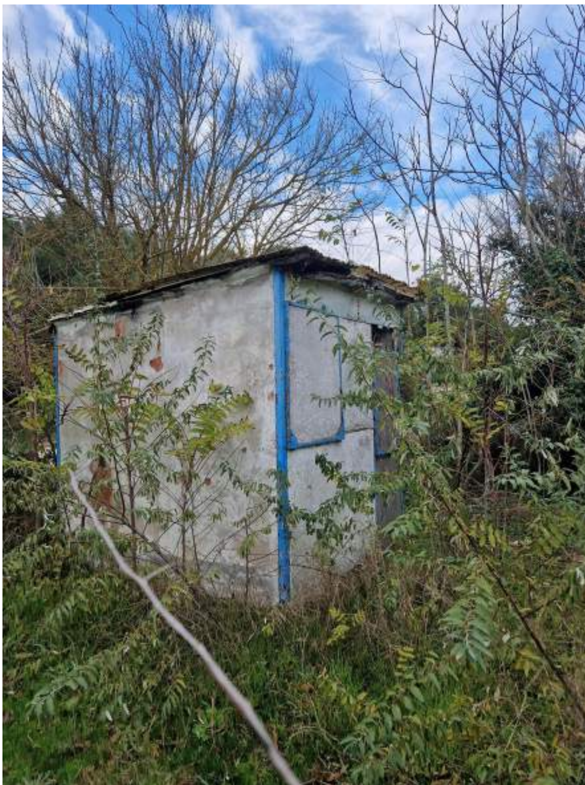
CAPANNO SENZA NUMERO