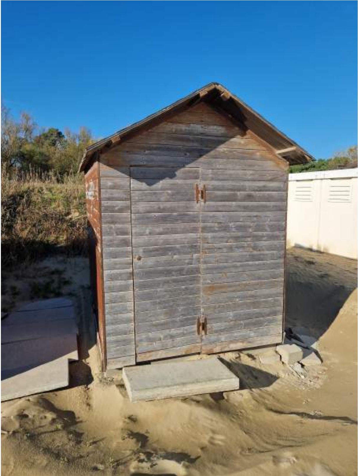
CAPANNO SENZA NUMERO