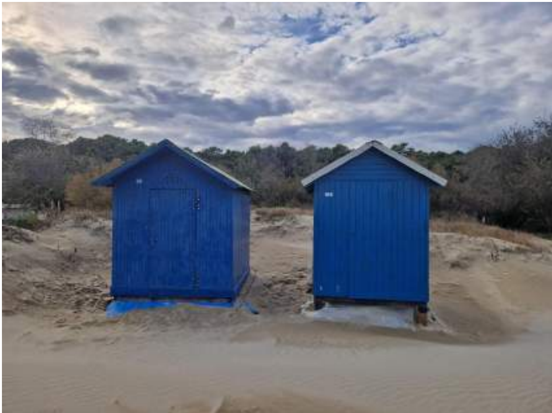
CAPANNI 106 - 99