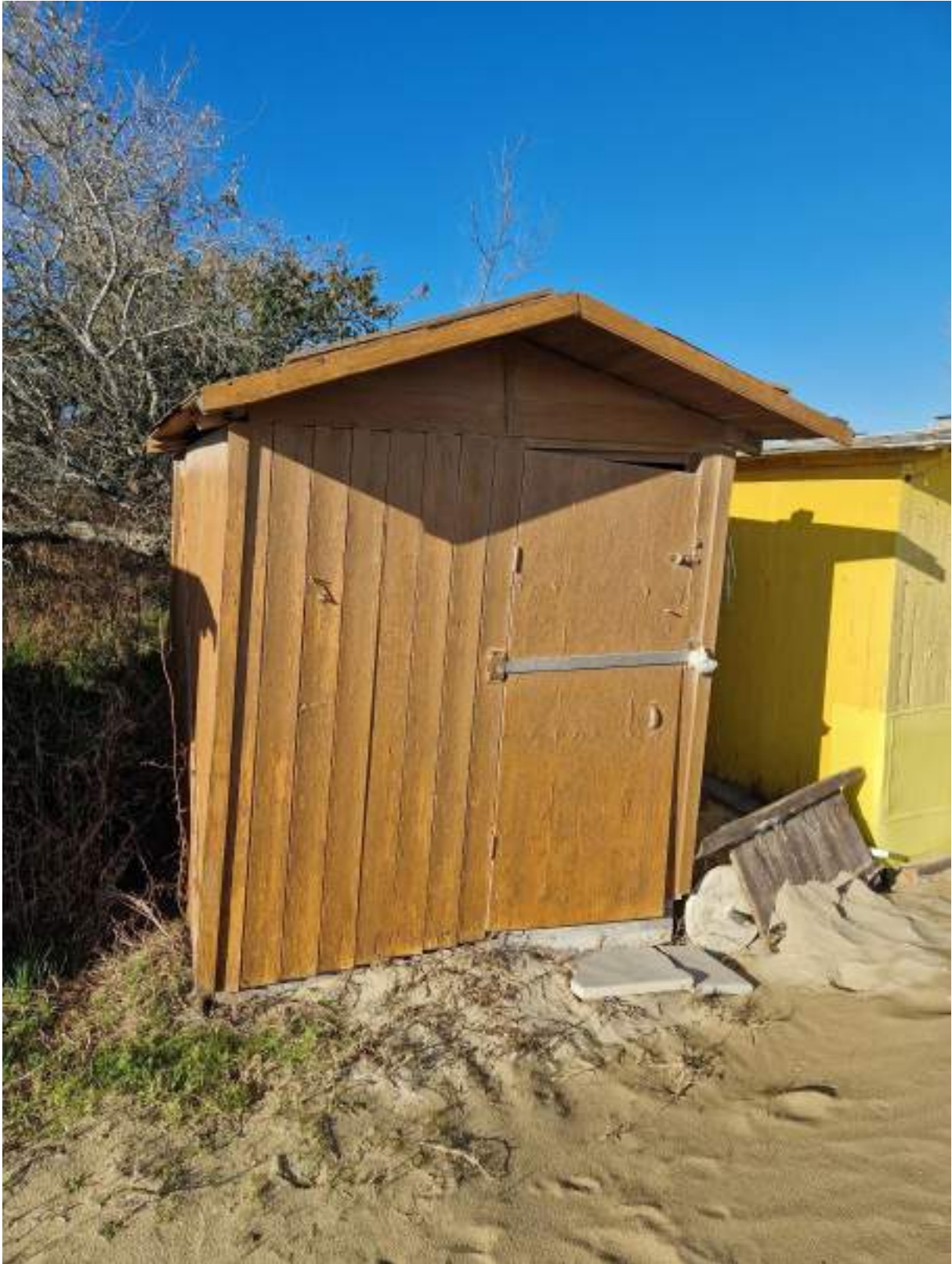
CAPANNO SENZA NUMERO