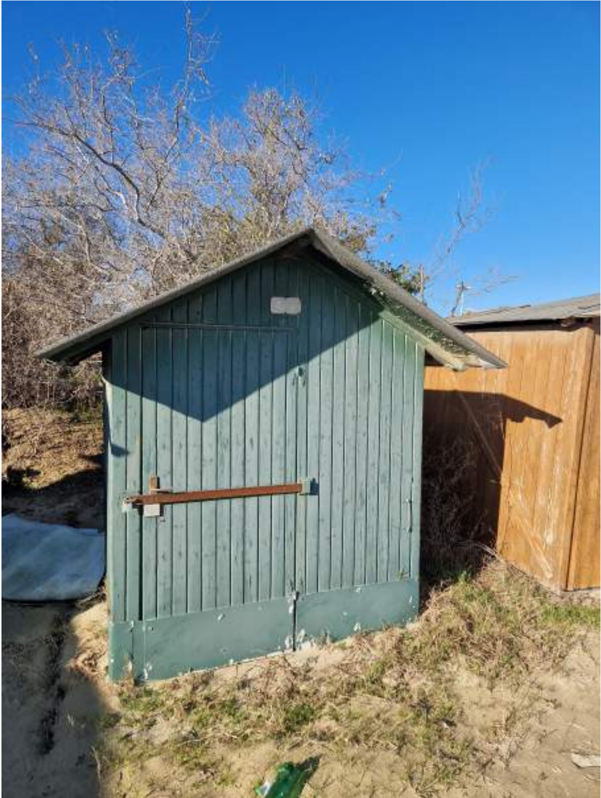
CAPANNO SENZA NUMERO