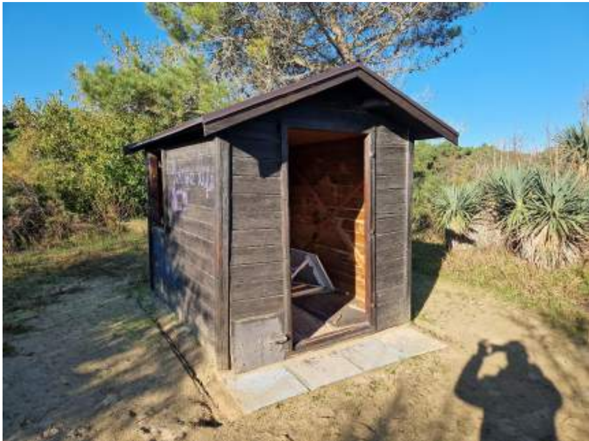
CAPANNO SENZA NUMERO