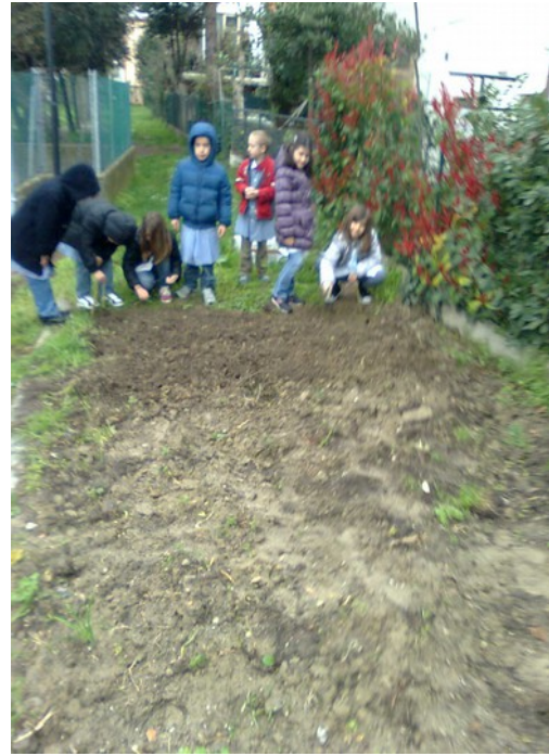
APRILE: I BAMBINI DI ALCUNE CLASSI SONO IMPEGNATI NELLA SEMINA