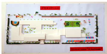
Il plastico del giardino della scuola realizzato dai ragazzi

Tale esperienza è stata presentata al FORUM di Firenze 2003 "Dire&Fare" insieme alla mostra della scuola dell'infanzia Mario Pasi "Dallo spazio immaginato allo spazio progettato" ed ha avuto un riconoscimento a livello nazionale. Nella primavera del 2004 si è svolto un incontro fra i tecnici del comune, i ragazzi e le insegnanti della scuola per illustrare il progetto definitivo del giardino scolastico.