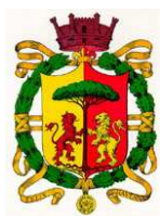
Comune di Ravenna