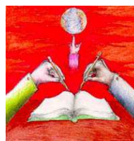
Consulta dei Ragazzi e delle Ragazze