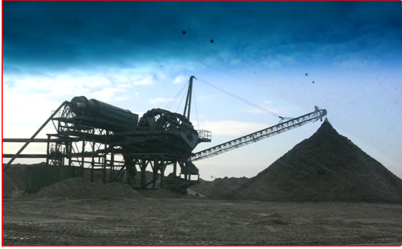
TAV. 10 - TRASFORMAZIONE DEL TERRITORIO