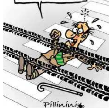
Immagine tratta "Siamo tutti pedoni" - Campagna nazionale per la sicurezza degli utenti deboli della strada

“I conducenti devono fermarsi quando i pedoni transitano sugli attraversamenti pedonali. Devono altresì dare la precedenza , rallentando e all'occorrenza fermandosi, ai pedoni che si accingono ad attraversare sui medesimi attraversamenti pedonali.”