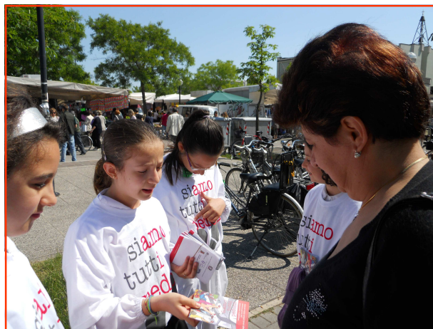
Gli studenti della Scuola Primaria Vincenzo Randi ambasciatori dello slogan "Siamo tutti pedoni" presso il mercato cittadino di Ravenna

L'obiettivo dell'Organizzazione delle Nazioni Unite è quello di riportare all'attenzione delle istituzioni e dei cittadini di tutti i Paesi, il tema delle lesioni da incidentalità stradale.