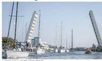
La regata in Darsena a vela

Si è chiuso Sport in Darsena, la quattro giorni di sport organizzata dal Circolo Velico Ravenna te per dare voce alle società sportive della città e contribuire nella rigenerazione della Darsena. Hanno partecipato più di 30 società sportive con momenti importanti di sport Spettacolo come quelli organizzati da Shine Parkour o dall' Edera sezione ritmica o dal Trick Shot organizzato dal Ravenna Basket. Un migliaio gli studenti che hanno partecipato. Domenica la manifestazione si è conclusa con un successo di presenze molto importante coronato dalla sinergia di Navigare per Ravenna.