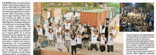
SALTO Un gruppo di ragazzi con le maglie di Darsena Pop Up. Sopra la cerimonia di inaugurazione