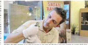
Attorno al 90° giorno si è ucciso l'uovo e in giro di 34 ore il piccolo Congo è uscito dall'uovo.

MIRACOLO ALLO ZOO il piccolo rettile fa parte di una specie super protetta