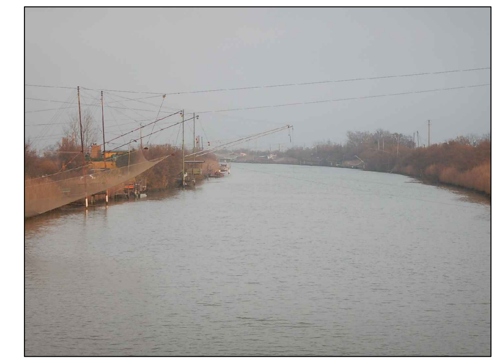
TAV. 8 - Profili del pelo libero dei Fiumi Uniti per gli eventi di piena di tempo di ritorno T=100 e 200 anni, nelle condizioni di esondazioni libere, in assenza ed in presenza di capanni da pesca