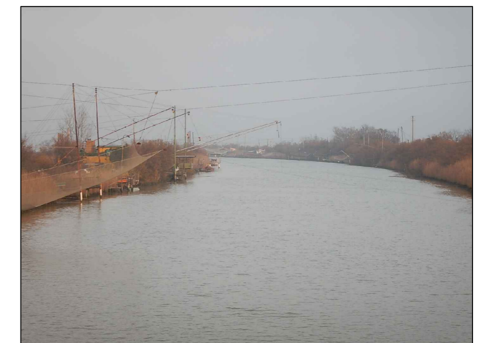
TAV. 10 - Profili del pelo libero del Fiume Lamone per gli eventi di piena di tempo di ritorno T=100 e 200 anni, nelle condizioni di esondazioni libere, in assenza ed in presenza di capanni da pesca