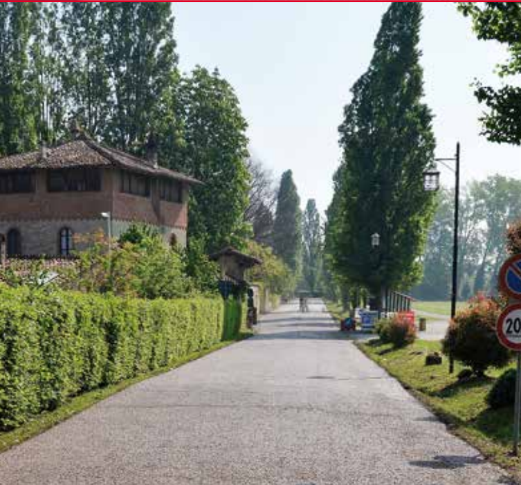
▲ VIA D'ACCESSO AL BORGO