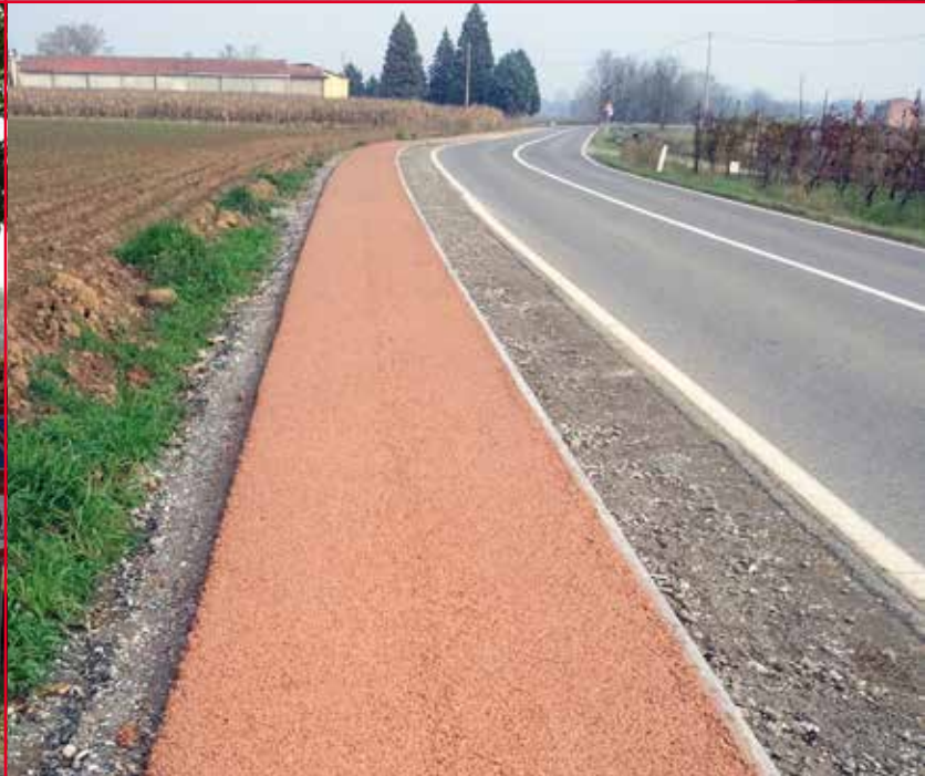
▲ PISTA CICLO PEDONALE