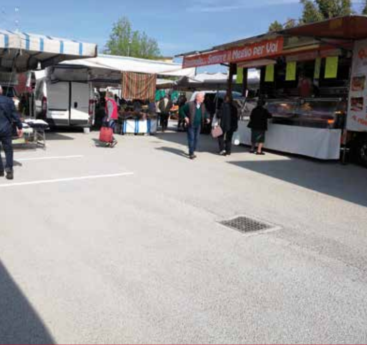
▼ PIAZZA MERCATO