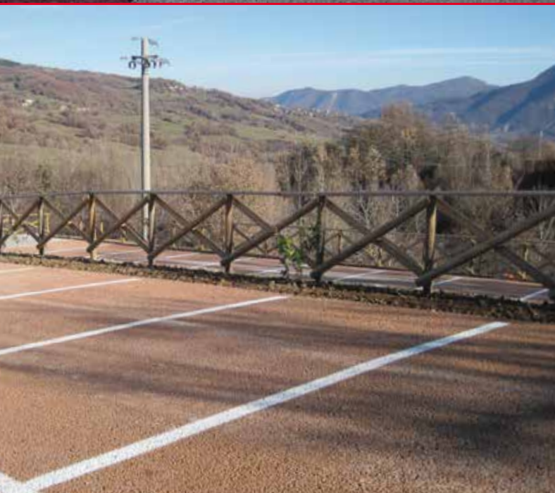
▲ PARCHEGGIO A BASSO IMPATTO PAESAGGISTICO