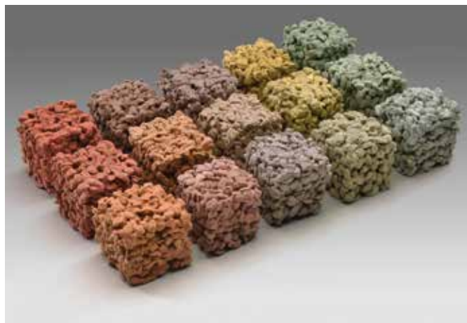
Colorazione con pigmenti.