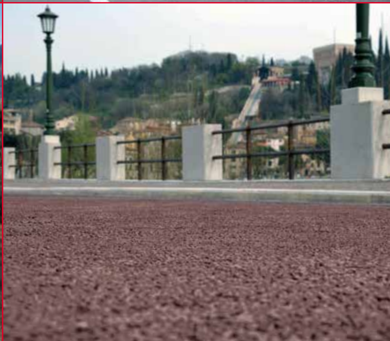
▲ ZONA PEDONALE