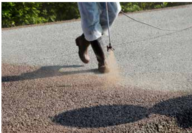
Colorazione con soluzione mineralizzante.

La superficie di DrainBeton® può essere inoltre colorata con specifiche soluzioni mineralizzanti non filmogene in molteplici tonalità che, penetrando nella superficie in colorazione naturale, rendono lo stesso materiale più resistente dagli agenti aggressivi (sali disgelanti, prodotti detergenti, azioni meccaniche tangenziali, raggi UV), donando un effetto cromatico totalmente uniforme e ancora più duraturo nel tempo, mantenendo inalterate le proprietà drenanti.