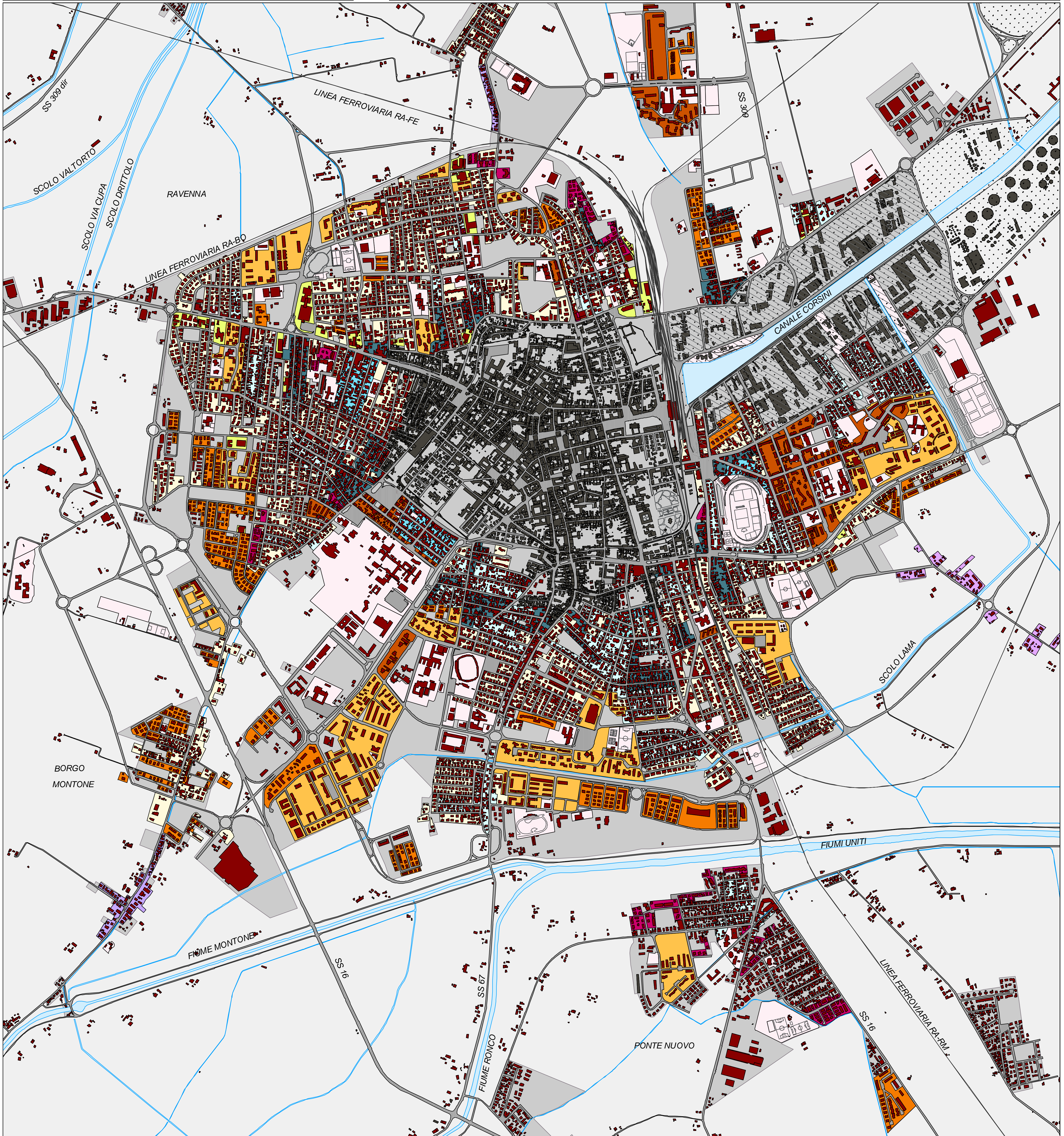
CARTA DEI CARATTERI DELL'INSEDIAMENTO: tessuti e ambiti capoluogo