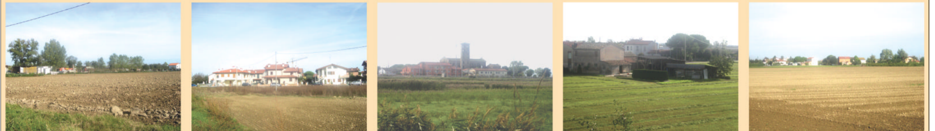
FOTO CON ESEMPI PUNTI DI VISTA INCONGRUI DA MASCHERARE &/O RIQUALIFICARE