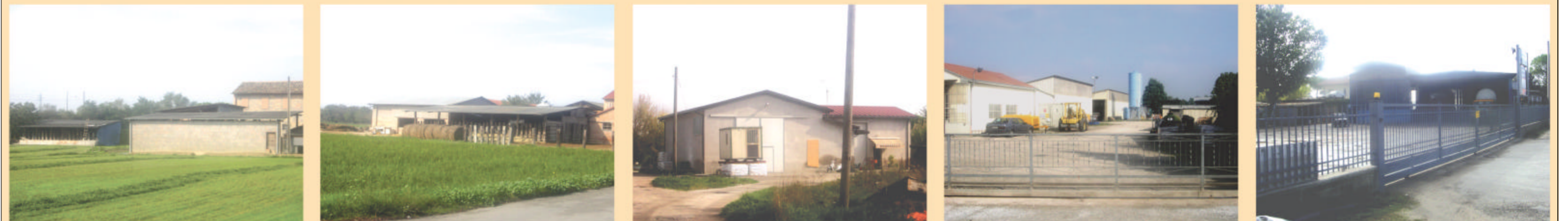
FOTO CON ESEMPI DI EDIFICI DA RECUPERARE/RIQUALIFICARE