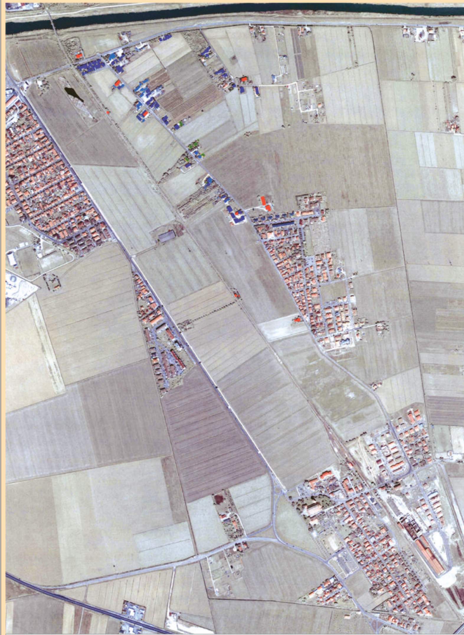
ZONA ARCHEOLOGICA DI CLASSE (FOTO AEREA 2003 CON DATAZIONE EDIFICI)