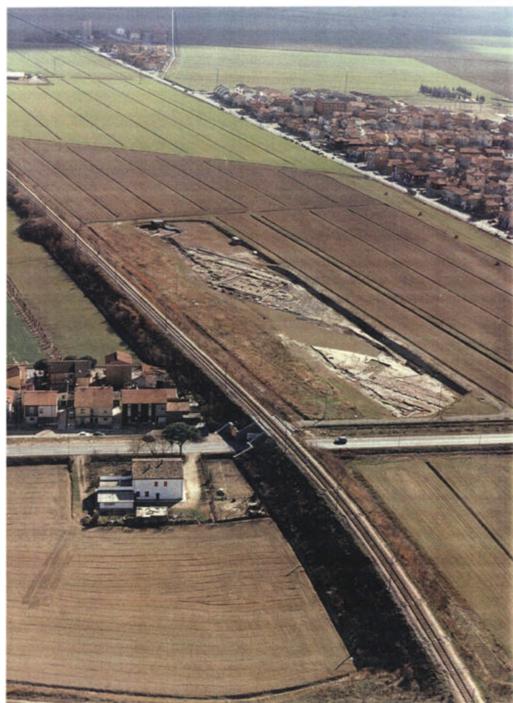
VEDUTA AREA DELLA ZONA ARCHEOLOGICA