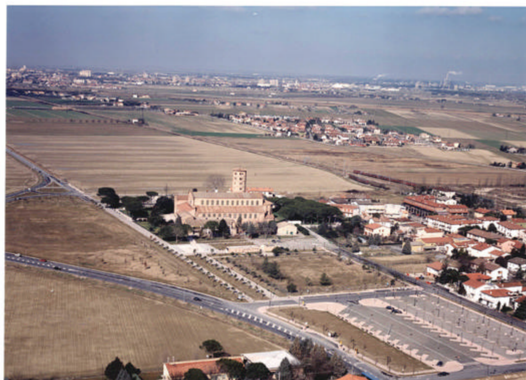
VEDUTA AREA DALLA BASILICA DI CLASSE VERSO IL PARCO ARCHEOLOGICO