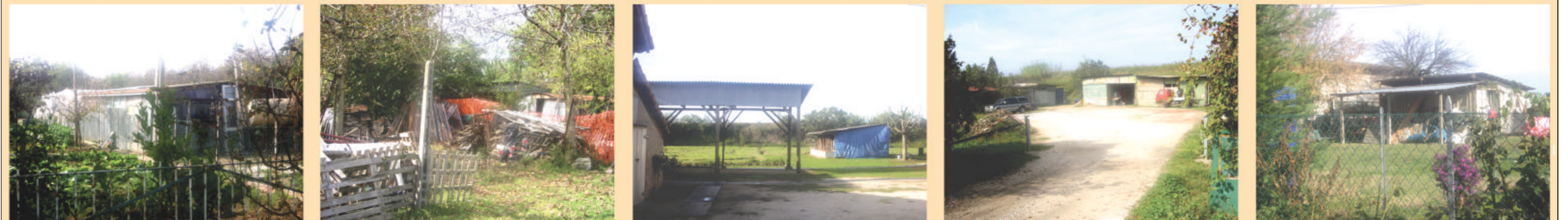
FOTO CON ESEMPI DI SUPERFETAZIONI &/O ELEMENTI INCONGRUI DA ELIMINARE