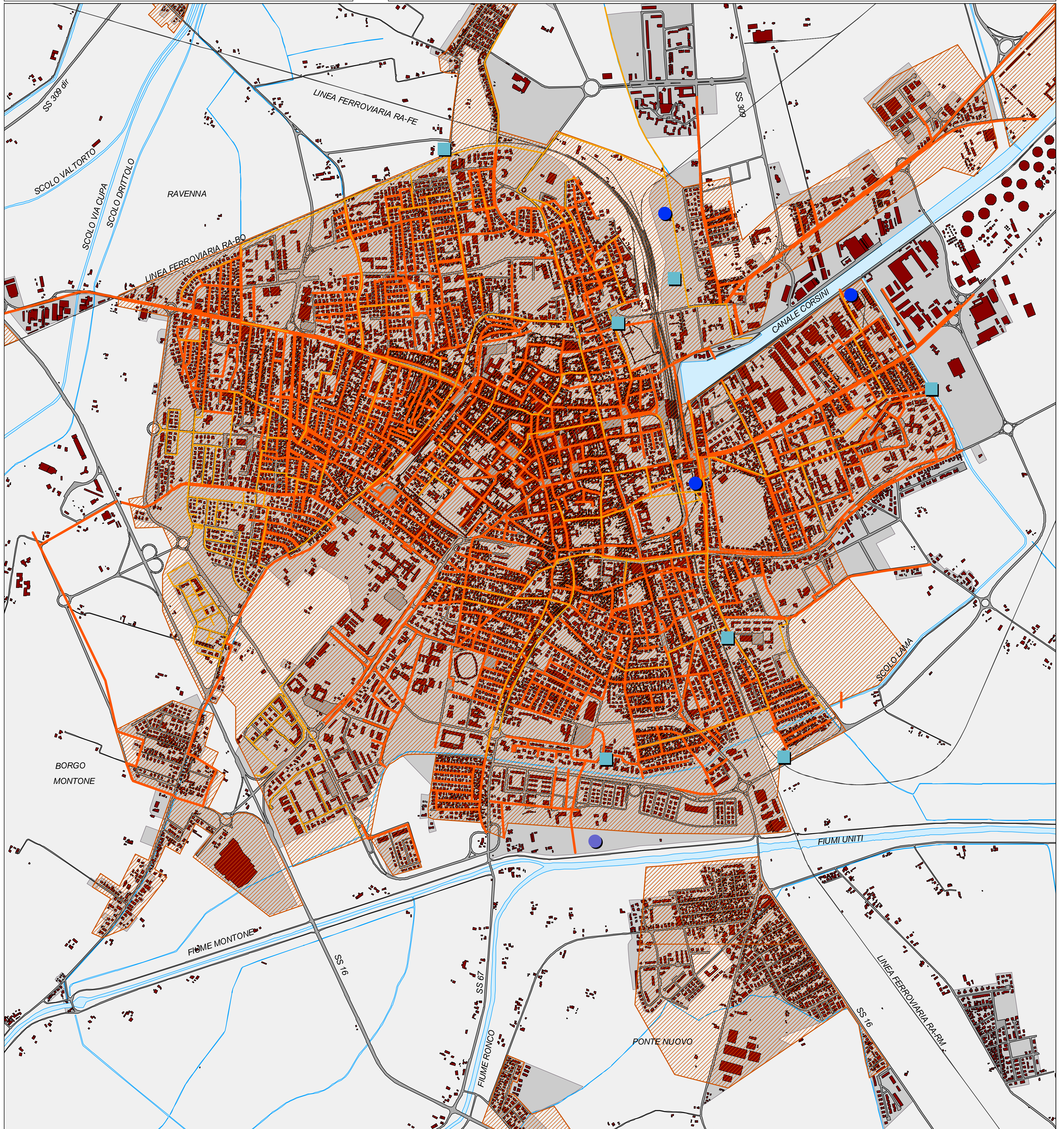
CARTA IMPIANTI E RETI TECNOLOGICHE: fognature del capoluogo (1) C.1.4.1.e