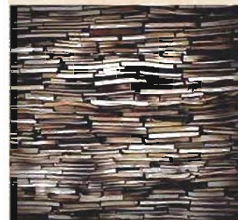
AREA CENTRALE percorso Culturale-Ricreativo