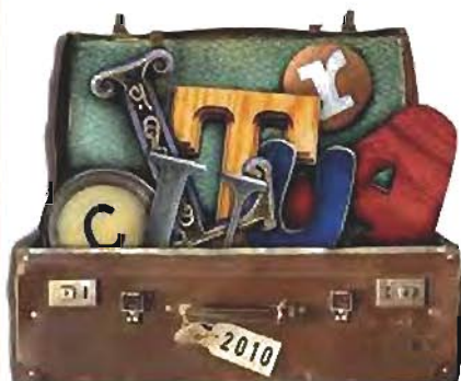
AREA DI TESTATA percorso Turistico-Commerciale