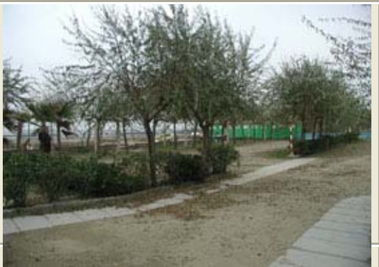
FOTO AREA A SUPPORTO DELLA BALNEAZIONE