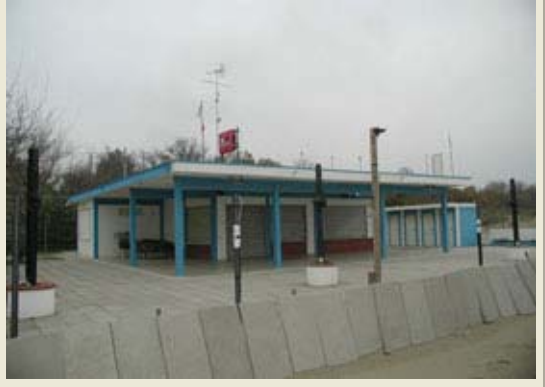
FOTO AREA DESTINATA ALLA BALNEAZIONE

ARREDI AIUOLE. PALO PER LA BANDIERA DI SALVATAGGIO.