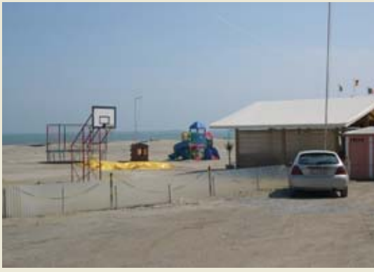
FOTO AREA DESTINATA ALLA BALNEAZIONE