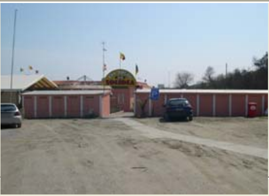
FOTO AREA A SUPPORTO DELLA BALNEAZIONE