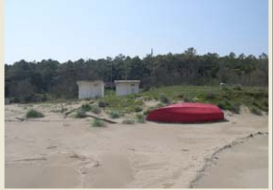
FOTO AREA DESTINATA ALLA BALNEAZIONE