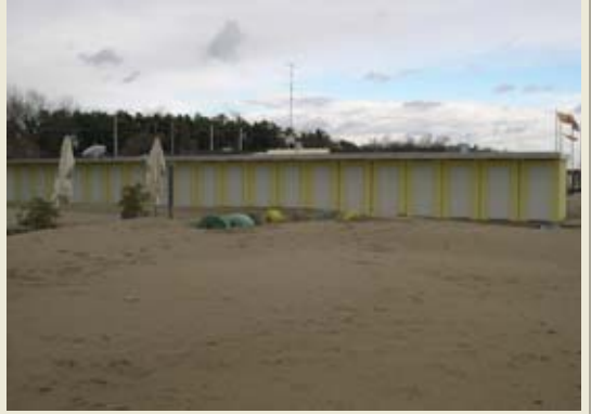
FOTO AREA DESTINATA ALLA BALNEAZIONE