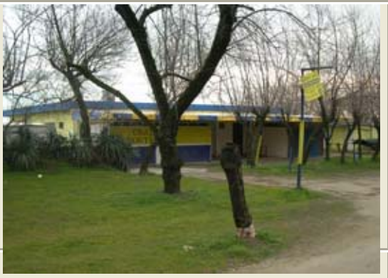
FOTO AREA A SUPPORTO DELLA BALNEAZIONE