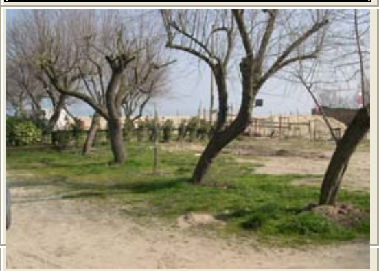
FOTO AREA A SUPPORTO DELLA BALNEAZIONE