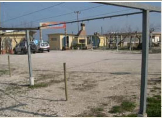
FOTO AREA A SUPPORTO DELLA BALNEAZIONE