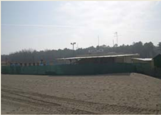
FOTO AREA DESTINATA ALLA BALNEAZIONE

PORZIONE DI PAVIMENTAZIONE IN LASTRE DI GHIAIA LAVATA.