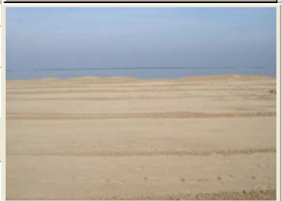
FOTO AREA DESTINATA ALLA BALNEAZIONE