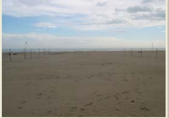
FOTO AREA DESTINATA ALLA BALNEAZIONE