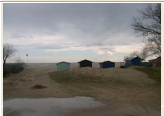
FOTO AREA A SUPPORTO DELLA BALNEAZIONE