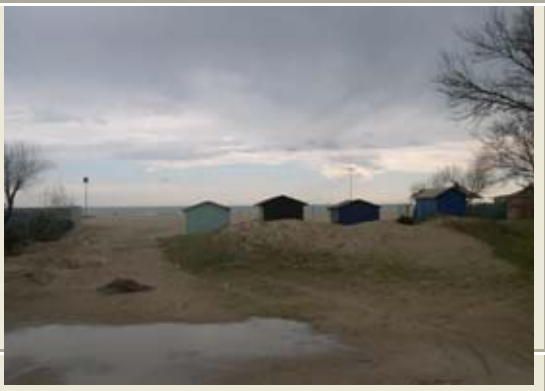
FOTO AREA A SUPPORTO DELLA BALNEAZIONE