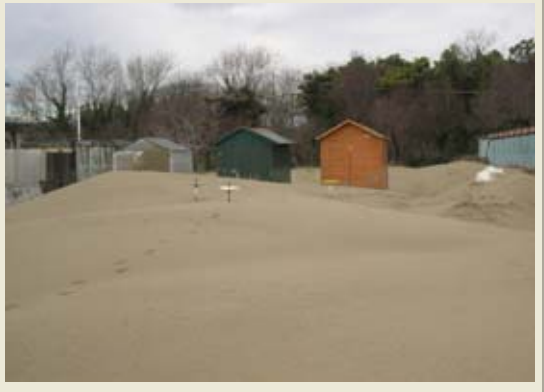
FOTO AREA DESTINATA ALLA BALNEAZIONE