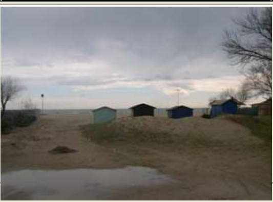
FOTO AREA A SUPPORTO DELLA BALNEAZIONE