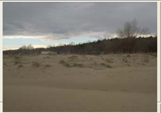
FOTO AREA A SUPPORTO DELLA BALNEAZIONE