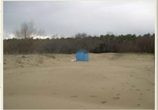
FOTO AREA DESTINATA ALLA BALNEAZIONE