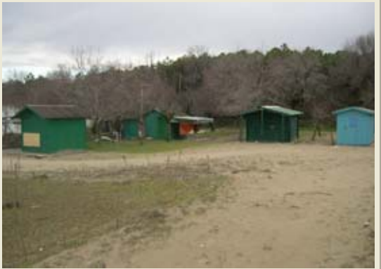
FOTO AREA DESTINATA ALLA BALNEAZIONE