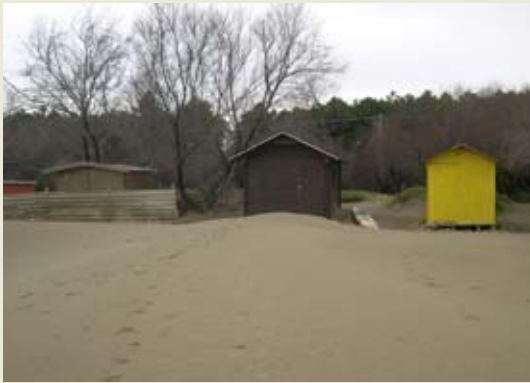
FOTO AREA DESTINATA ALLA BALNEAZIONE