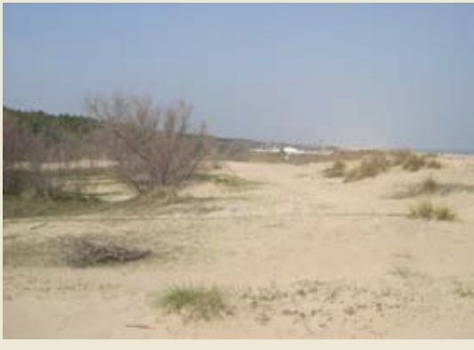
FOTO AREA DESTINATA ALLA BALNEAZIONE