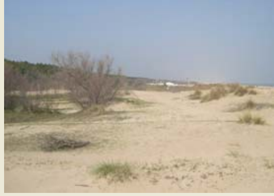
FOTO AREA DESTINATA ALLA BALNEAZIONE