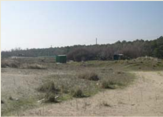
FOTO AREA DESTINATA ALLA BALNEAZIONE