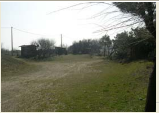
FOTO AREA A SUPPORTO DELLA BALNEAZIONE