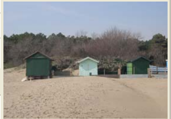
FOTO AREA DESTINATA ALLA BALNEAZIONE