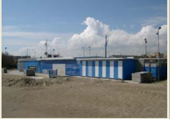
FOTO AREA DESTINATA ALLA BALNEAZIONE

TITOLI EDILIZI RILASCIATI ATTERRAGGIO NATANTI: LARGHEZZA: 0 LUNGHEZZA: 0