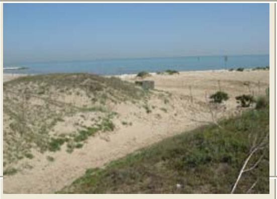
FOTO AREA A SUPPORTO DELLA BALNEAZIONE