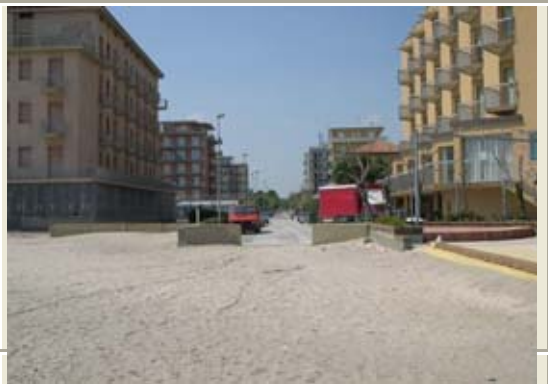
FOTO AREA A SUPPORTO DELLA BALNEAZIONE