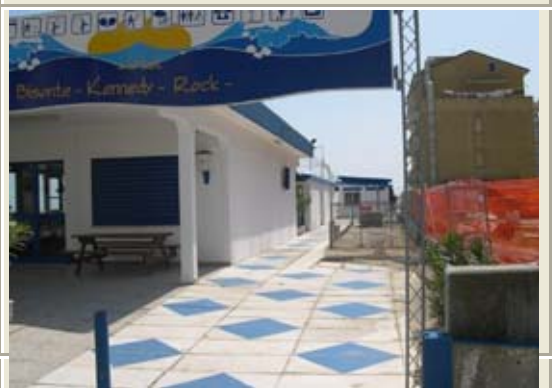
FOTO AREA A SUPPORTO DELLA BALNEAZIONE