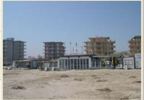
FOTO AREA DESTINATA ALLA BALNEAZIONE