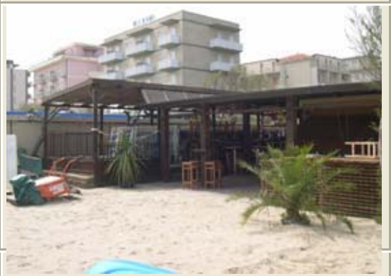
FOTO AREA A SUPPORTO DELLA BALNEAZIONE